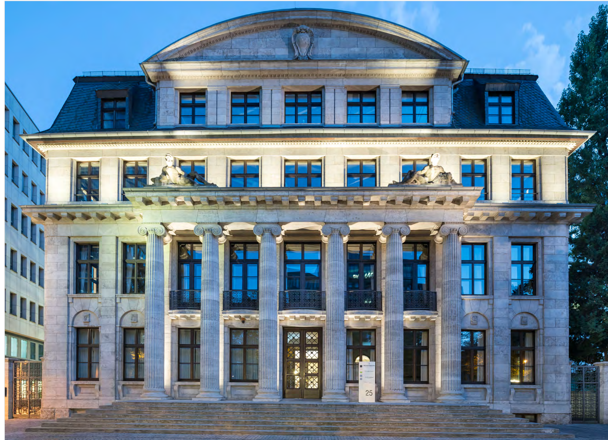
Aberdeen Investments, Frankfurt am Main